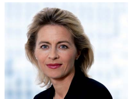
Erstmals eine Frau im Amt: die neue Bundesarbeits- und Sozialministerin Ursula von der Leyen

Bereits Ende November trat dann Bundesminister Franz Josef Jung zurück. Es war die bislang kürzeste Amtszeit eines Arbeitsministers. Welche Schwerpunkte seine Nachfolgerin, Ursula von der Leyen, vor allem in der Arbeitsmarktpolitik setzen wird, muss abgewartet werden. Bislang hat sich Frau von der Leyen in diesem Politikbereich noch nicht profiliert.