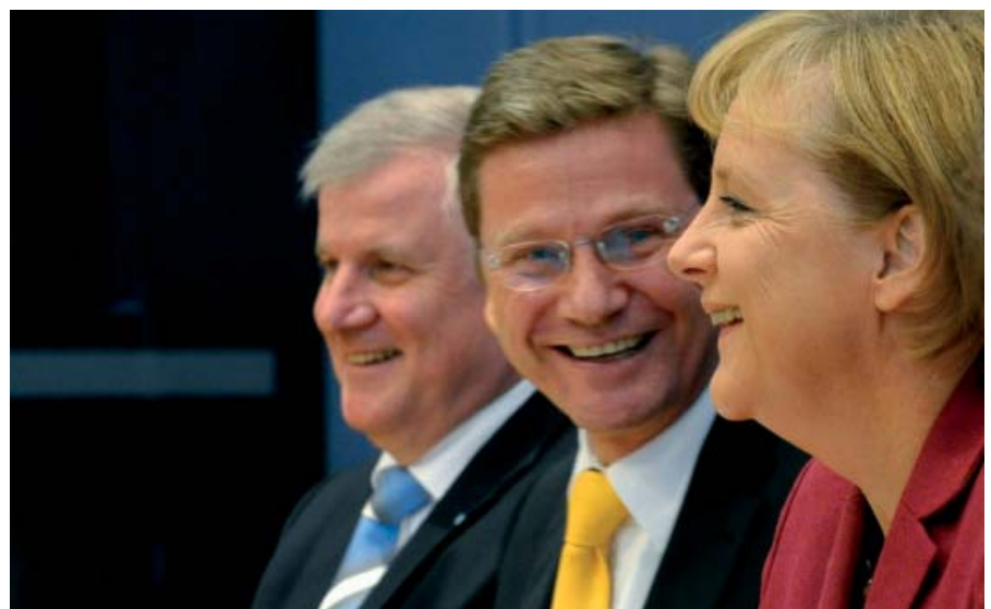
Nach Ansicht von Horst Seehofer, Guido Westerwelle und Angela Merkel ist der Koalitionsvertrag eine gute Grundlage für die kommenden Jahre.