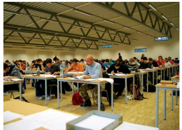
Die erste „Feuertaufe“ bei der Durchführung der Staatlichen Abschlussprüfung hat das neue Prüfungsgebäude bereits hinter sich.

Neben der Funktion als zentraler Prüfungsort für die Staatliche Abschlussprüfung ist in dem neuen Gebäude aber auch der eigenständige Bereich Produktentwicklung und Produktsicherung (kurz Pe/Ps genannt) untergebracht.