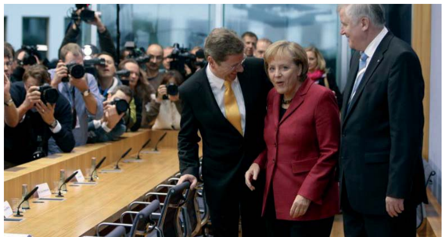
28. Oktober 2009: Der Koalitionsvertrag steht - Aufbruch oder Fehlstart?