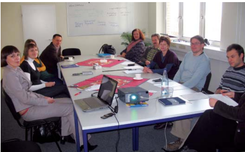
Partner des Projektes 3xC aus Polen, Deutschland und Griechenland bei einem transnationalen Partnertreffen in Berlin

Am Standort Kassel erfasst das Projekt AidA (Alleinerziehende in der Altenpflege) alleinerziehende Frauen im Alter von ca. 25 bis 35 Jahre mit Berufsabschluss im Bereich Gesundheit & Soziales oder einer vergleichbaren Qualifikation. Ziel ist es, langfristig die Berufstätigkeit in die Lebensplanung mit einzubeziehen und zu realisieren.