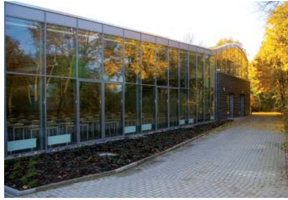
Das neue Gebäude schafft für die Prüfungen des DAA-Technikums optimale Rahmenbedingungen.

Knapp ein Jahr ist es nun her, als das DAA-Technikum endlich sein eigenes Prüfungsgebäude in Osnabrück einweihen konnte. Damit hat das DAA-Technikum mit den drei Studien- und Prüfungszentren in Würzburg, Jena