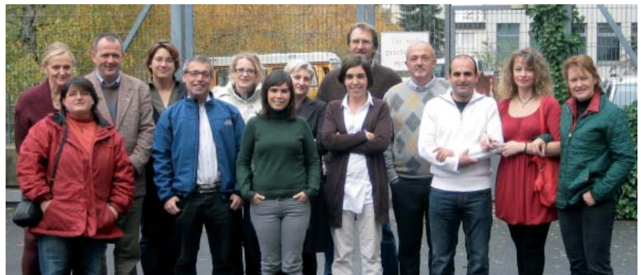
Teilnehmer des Kick-Off Meetings zum neuen Leonardo Projekt PawsMed November 2009 in Berlin

Diese Schwerpunkte spiegeln sich auch im Projekt-Kernteam wieder.