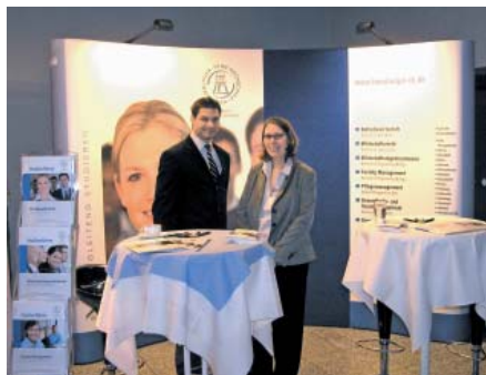
Der Stand der HFH beim Deutschen Weiterbildungsforum Ende Juni in Bonn

Nicht nur mit ihren Studienzentren ist die HFH vor Ort – auch auf Messen in Deutschland, Österreich und der Schweiz ist die Fernhochschule präsent. Auf über 40 Fach- und Bildungsmessen konnten sich Interessierte in diesem Jahr über das Angebot der HFH und das Studienkonzept informieren, beispielsweise auf der „Zukunft Personal“ in Köln oder bei verschiedenen Jobmessen in Osnabrück, Essen, Berlin, Bremen und im Emsland.